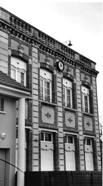
Façade de l'usine Lille.

Située à la pointe de la Champagne pouilleuse, Marigny n'offre au XIX e siècle à ses habitants que de maigres ressources agricoles. A la morte saison, ils deviennent bonnetiers d'hiver au sein d'ateliers familiaux, avant d'être, au cours du XX e siècle, de plus en plus occupés dans des usines désormais inactives, victimes de la crise de la bonneterie.