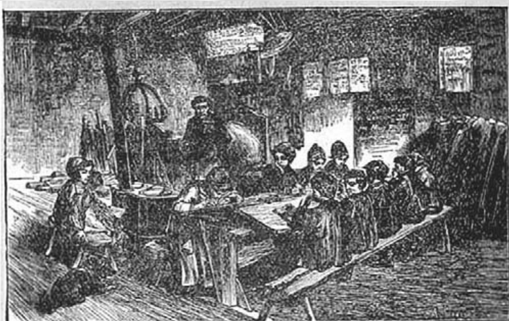
ÉCOLE PRIMAIRE D'AUTREFOIS.

Cette visite auboise de Ferdinand Buisson, déjà venu à Troyes en 1914, apparaît au départ comme une entreprise fortement politique.